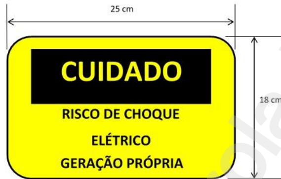
Figura 3: Placa de advertência.