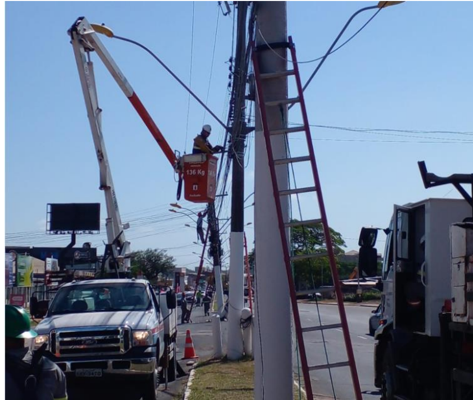
Dia 29/10/2021, 11h.