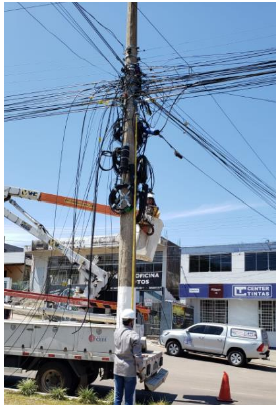
Dia 04/10/2021, 11h.