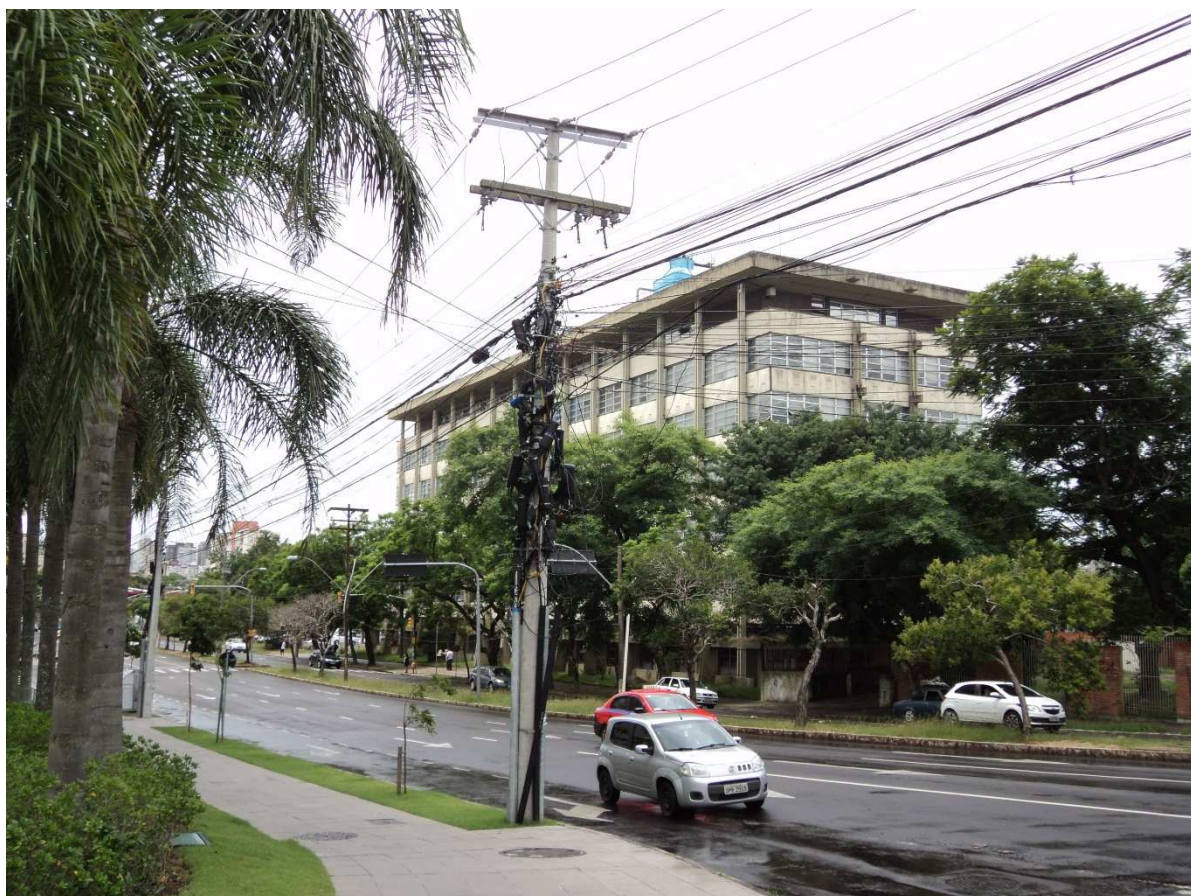
Figura 2: Poste entre as avenidas Borges de Medeiros e Ipiranga.