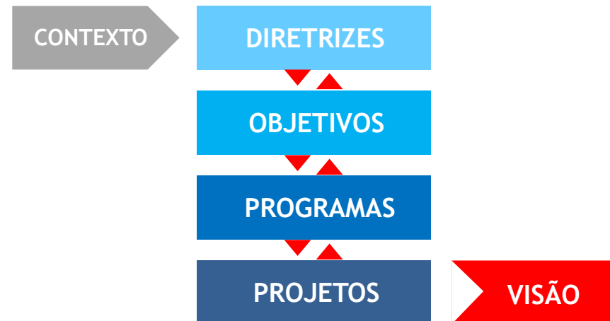
Diagrama que reúne os principais objetivos estratégicos, traduzidos na forma de programas, projetos e iniciativas.